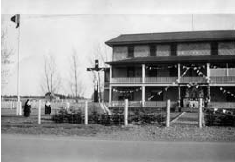
[1945]. Monastère Notre-Dame-du-Grand-Pouvoir, Rivière-Jacquet, Nouveau-Brunswick.