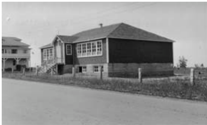
[1947]. École Marie-Guyart, Rivière-Jacquet, Nouveau-Brunswick. Fonds photographiques du Monastère des Ursulines de Rivière-Jacquet, PH-OSUQ-RJ/019.

Dès la première année, les Ursulines reçoivent 325 élèves (garçons et filles), des plus petits aux plus grands, dans la salle paroissiale qui porte le nom d'École Marie-Guyart. En 1947, elles prennent la décision d'enseigner aux garçons seulement jusqu'à la cinquième année. Les Pères Salésiens en 1948 prendront la relève pour la totalité de leur éducation. Le manque d'espace fait en sorte qu'une nouvelle construction est nécessaire. Le 4 février 1947, l'école Marie-Guyart ouvre ses portes dans des nouveaux locaux contenant quatre classes avec sous-sol. Les Ursulines assument au complet les frais