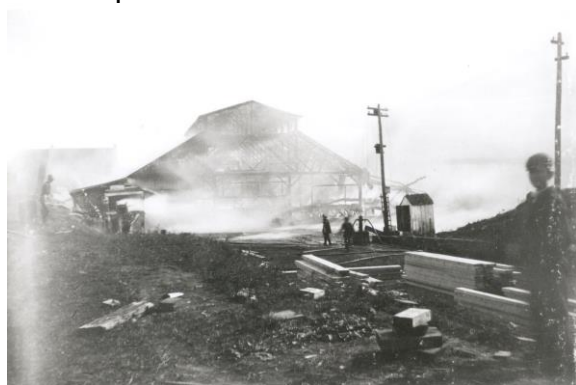
Incendie de la St-Maurice Lumber Co.

L'album nous convie à un voyage aux côtés de la petite bourgeoisie trifluvienne de la fin du XIX e siècle. On accompagne la famille au travail comme en villégiature, à Shawinigan, Saint-Léon, Plessisville et même aux États-Unis. Voici quelques-unes des 500 photos parmi les plus intéressantes et les moins utilisées dans les publications :