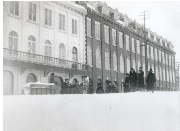
Hôtel Dufresne : Déneigement de la rue du Fleuve

de l'hôtel et le feront prospérer jusqu'au terrible incendie de juin 1908. Suite à cette catastrophe, l'Hôtel Dufresne déclarera des pertes de 60 000 $, une somme imposante pour l'époque et la plus élevée parmi tous les hôtels détruits dans la conflagration.