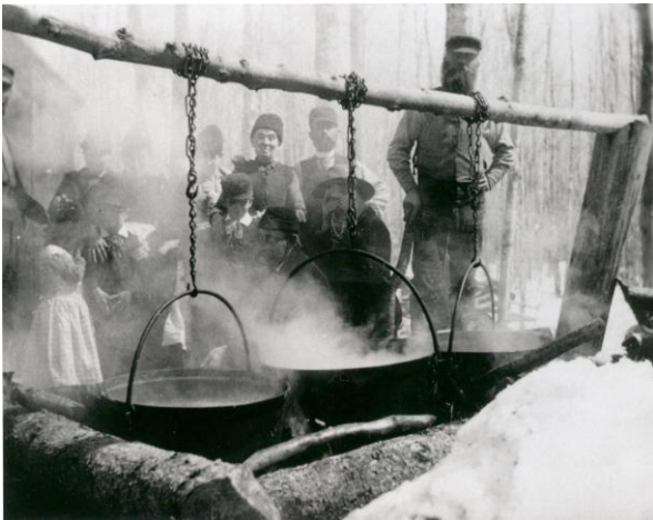
Temps des sucres : évaporation de l'eau d'érable