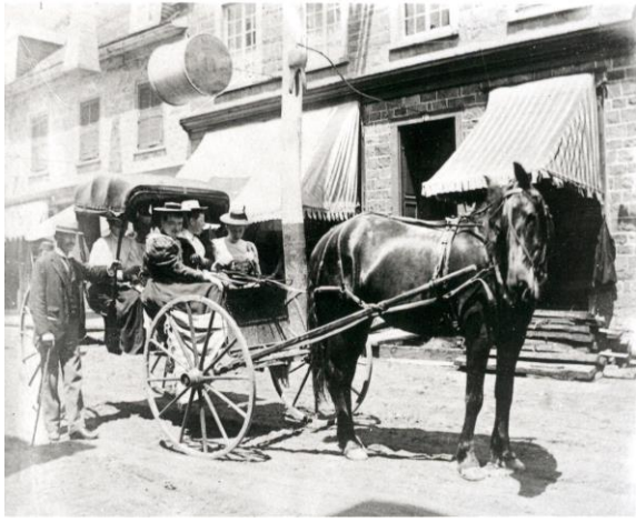
AUTR, VII-013-9004-049 Calèche sur des Forges