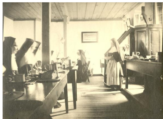
AUTR, III-C-02-9011-043 repas

Une fois les plats amenés au bout des tables, au réfectoire, les religieuses se les passaient en se servant elles-mêmes. Après le repas, chacune lavait son couvert dans les plats d'eau apportés à cet effet.