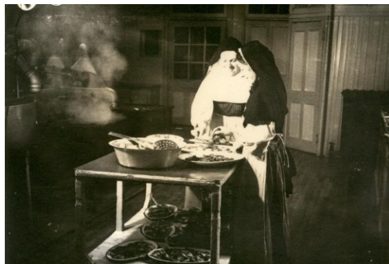
AUTR, III-C-02-9012-013 préparation des mets

Dans les nombreux travaux qui reviennent quotidiennement, il y a tout ce qui se rapporte aux repas. Les soeurs converses préparaient donc la nourriture, parfois aidées de postulantes.