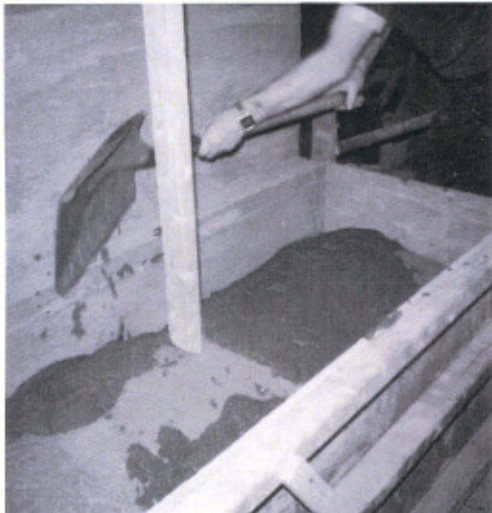
AUTR, III-C-02-9010-102 inhumation dans la crypte